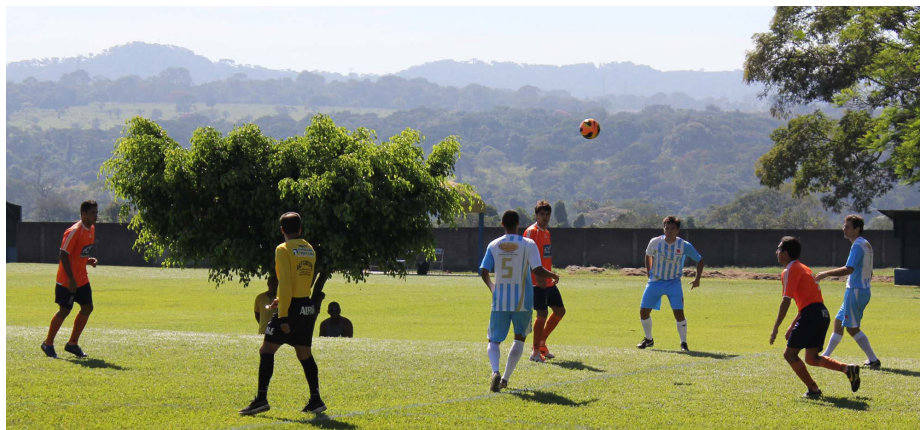
Bradesco T9 e Mercantil em partida válida pela sexta rodada da semi final