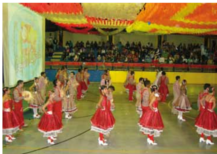
Foto de grupo participante do Arraiá em 2011

A tradicional festa junina do Clube dos Bancários, em parceria com a empresa junina Caipirada Capim