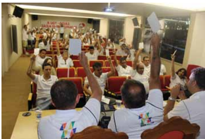
A minuta do encontro de Itumbiara será levada ao 17º Encontro Nacional da Contec, que será realizado em Salvador (BA), dias 4 e 5 de julho, para a unificação da campanha salarial tanto dos bancos privados como dos oficiais

Os trabalhos foram coordenados pelo presidente da